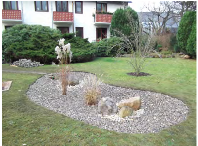
Anlage eines Trockenteiches

Optisch wird der Trockenteich aufgewertet, indem man einige Findlinge in verschiedenen Größen auf der Kiesfläche einarbeitet. Eine Bepflanzung mit Gräsern in unterschiedlichen Wuchshöhen ist eine weitere optische Bereicherung. Auch ein anderer, nicht unwesentlicher Gesichtspunkt ist interessant: In naher Zukunft werden Gebühren für das Einleiten von Regenwasser erhoben, die minimiert werden können oder gar ganz wegfallen, wenn die Versickerung von Regenwasser auf dem eigenen Grundstück erfolgt.